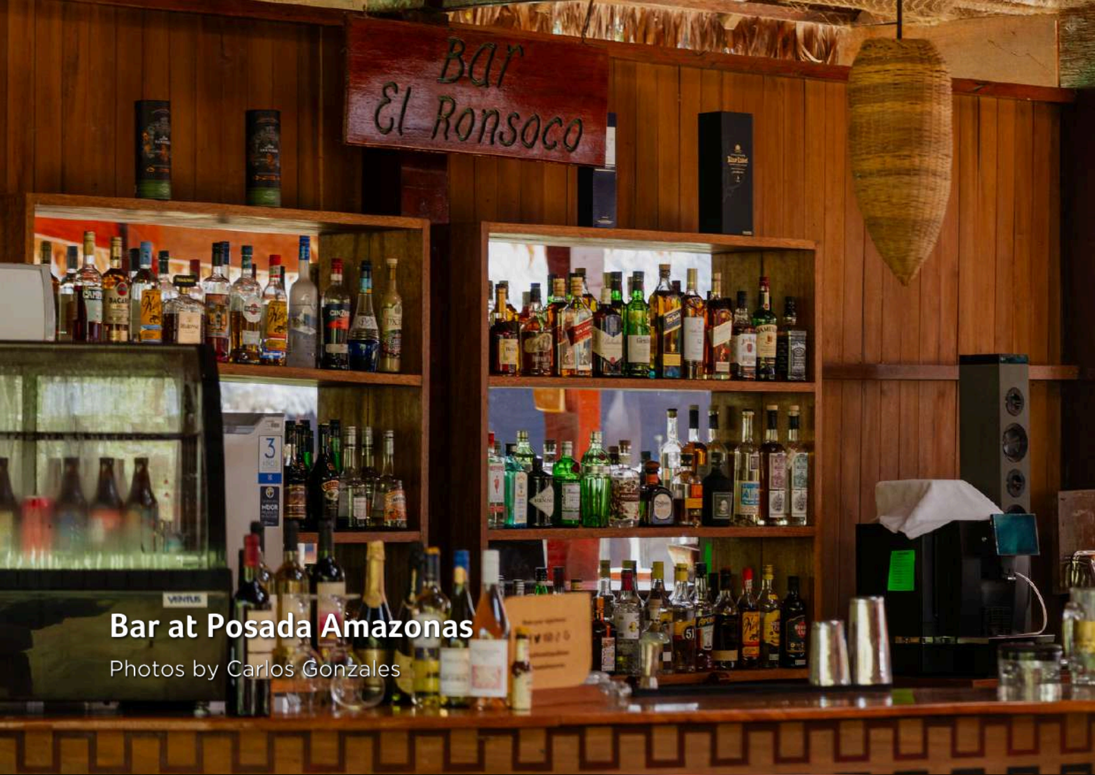
Bar at Posada Amazonas